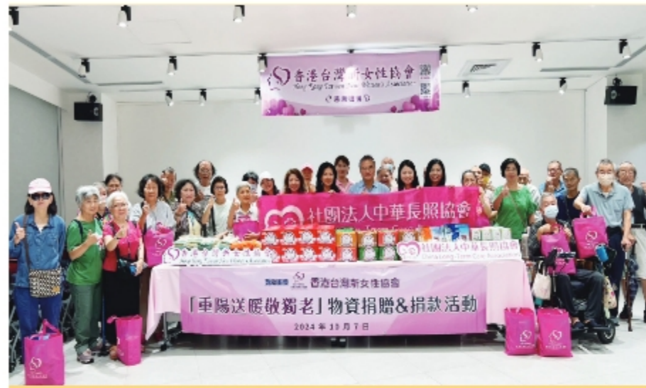
香港台灣新女性協會及中華長照協會於重陽前夕至新店央北社宅捐贈愛心物資

香港台灣新女性協會亦同時至中華長照協會獨居老人公寓-「永樂居」了解獨老住宅服務並致贈重陽禮品，以具體行動關懷家鄉，在國慶前夕讓人倍感溫情。